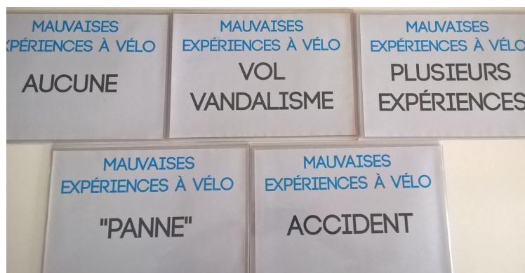
Exemple de légendes pour la réalisation d'une figure sur les mauvaises expériences à vélo